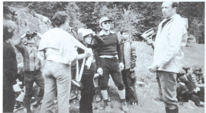
Jugendfreizeiten in Schwenden