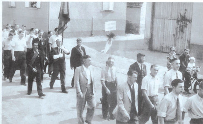
Festzug in Liedolsheim 1950

Anlässlich des 50jährigen Jubiläums veranstaltete der Verein ein Schülerturnfest, sowie das Gualterstreffen des Karlsruher Turngaus, dem der TV Liedolsheim inzwischen angehört. Im gleichen Jahr nahm der Verein mit 23 Wettkämpfern am Gauturnfest in Bruchhausen