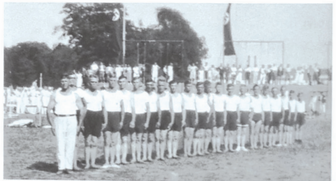
Vereinsriege 1935 in Karlsruhe

Das letzte große Ereignis war der Besuch des Landeturnfestes 1935 in Karlsruhe mit einer Vereinsriege von 20 Turnern.