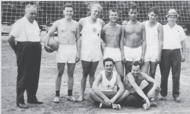
Volleyballmannschaft beim Landesturnfest 1964

Die 60er Jahre ließen schließlich eine Volleyballabteilung entstehen, die durch ihre Erfolge in der Verbandsliga sehr bald zu einem Aushängeschild wurde. Seit 1968 führen wir alljährlich ein Volleyballturnier durch, an dem sich viele Vereine beteiligen.