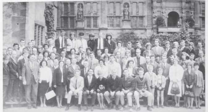
Besuch der Turnfreunde aus Ringgenberg 1965 Schloß Heidelberg

sollte es dauern, bis am 17. November 1967 die Turn- und Schwimmhalle mit Leben erfüllt wurde. Damit fand auch der Turnverein optimale Bedingungen für die Ausübung der Hallensportarten. Gleichzeitig stand den TV-Mitgliedern die Schwimmhalle an einem Abend in der Woche zur Verfügung.