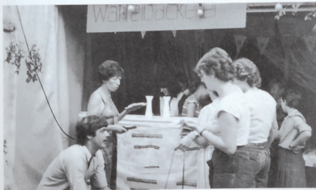
Der Turnverein beim 1. Liedolsheimer Straßenfest