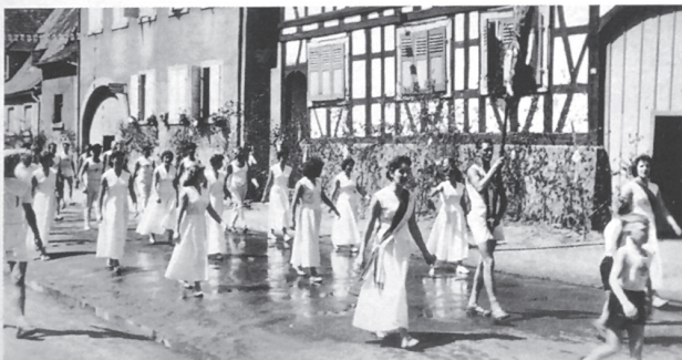
Unser Verein beim Festzug 1957 in Liedolsheim

Neben dem laufenden Turnbetrieb war es in den nächsten Jahren immer wieder der Ausbau der Sportanlage, welcher von den Mitgliedern viel Idealismus und Opferwilligkeit erforderte, bis sie im Jahre 1957 erstmals in Betrieb genommen werden konnte. Doch die endgültige Fertigstellung sollte den Verein noch lange, bis in die heutige Zeit, beschäftigen.