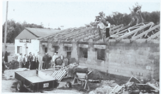
Richtfest Erweiterung Vereinsheim 1993

Obwohl der Trend zum Dienstleistungsbetrieb auch bei den Vereinen anhält, blickt der gegenwärtige, nachstehend aufgeführte Vorstand mit großer Zuversicht in die Zukunft,