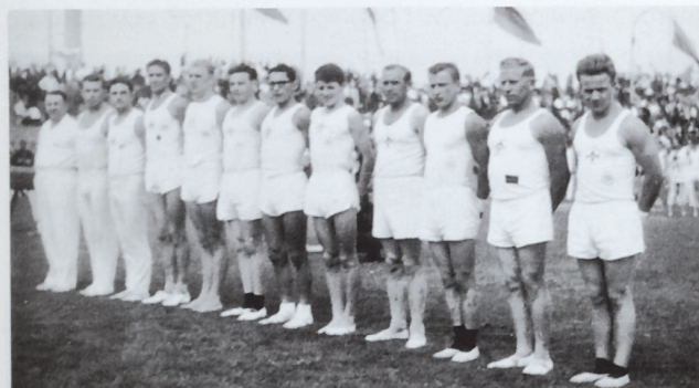
Vereinsrieger 1963 in Essen