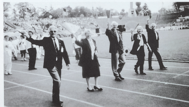
Einzug zur Abschlußveranstaltung 1997 Karlsruhe