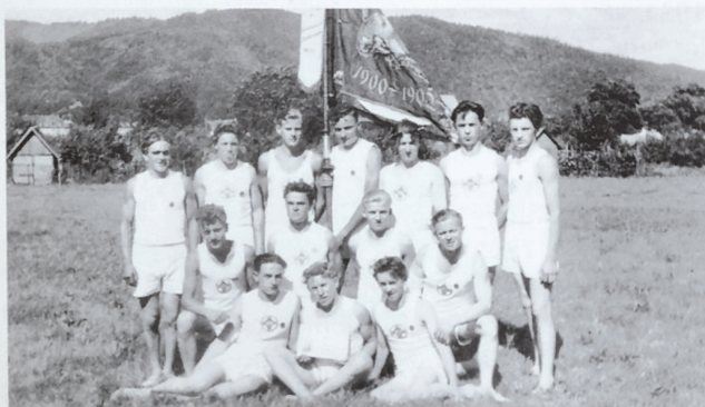
Vereinsrieger 1954 in Freiburg