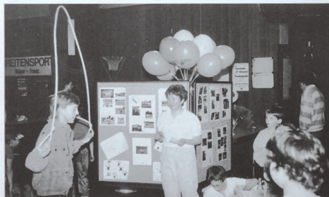
Tag der offenen Tür, die Abteilungen stellen sich vor