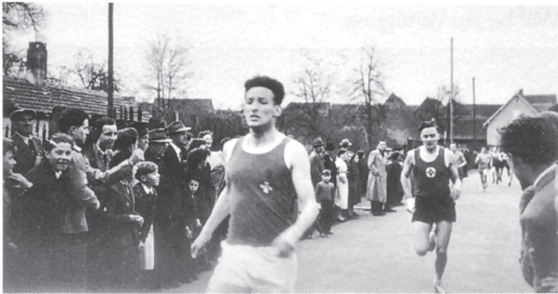
Ziel Osterlauf 1955

1955 stieg die Teilnehmerzahl beim Osterlauf auf über 100 an. Im gleichen Jahr ließ sich der Turnverein in das Vereinsregister eintragen.