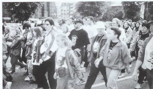
Beim Festzug Deutsches Turnfest 1994 Hamburg